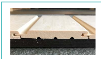
Softline: ronde afwerking,

Verschil schroten fase profiel en softline